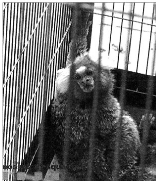
Els xòfers detinguts introduïen tota mena d'articles falsificats. A la dreta, animals exòtics confiscats pels Mossos d'Esquadra