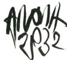
•• Els projectes de la patronal anoienca es basen en l'"Anoia 2032", un llibre amb els desitjos del futur que s'ha acabat convertint en tot un lema