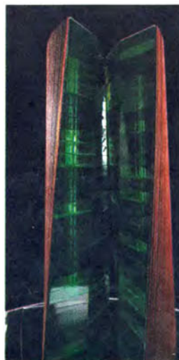
•• El "Brain of the World", un centre internacional de coneixement i negoci que vol construir la UEA a l'Anoia

El "Brain of the World" seria el centre de trobada per als líders de pensament de tots els àmbits (universitats, centres de recerca, empreses privades, organitzacions governamentals, etc.) per dur a terme projectes transversals