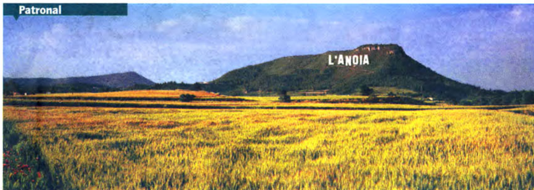
•• Una aparença de Hollywood, al bell mig del puig Aguilera d'Òdena. La imatge reflecteix l'esperit dels projectes que ha presentat la UEA.